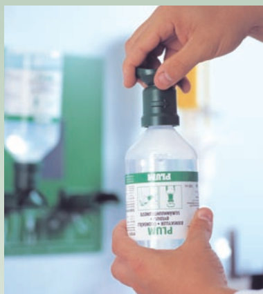
Girar la tapa hasta que se rompa el sello.