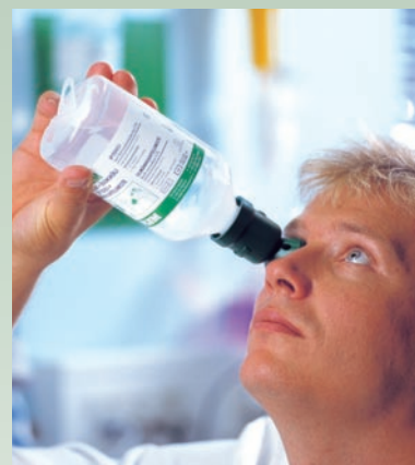
Inclinar la cabeza hacia atrás y enjuagar.