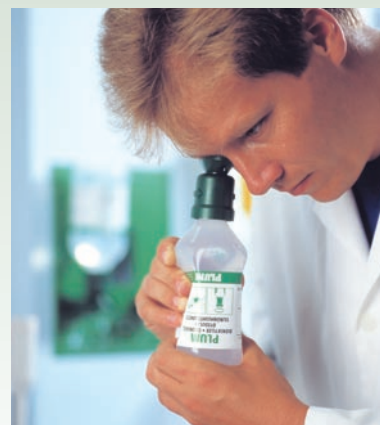
En el caso de cuerpos extraños en el ojo, puede ser conveniente inclinar la cabeza hacia adelante y enjuagar.

Con cualquier tipo de lesiones, el líquido debe aplicarse al ojo cuidadosamente y con un flujo constante. Presione ligeramente la botella, sin estrujarla. Solicite siempre ayuda médica y continúe enjuagando durante el traslado.