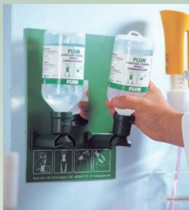
Retirar horizontalmente la botella de la estación.